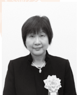
松陵中学校事務職員