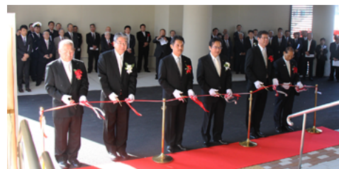
テープカットの様子