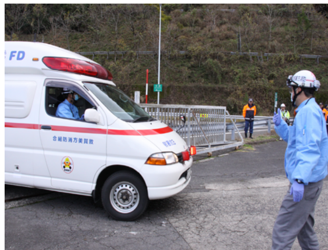
北陸自動車道杉津PAの開口部から一般道に向かう救急車

同施設は、1階から3階までの吹き抜け構造を生かしたネット遊具やクライミングウォール、ボールプールなどを設置する予定で、平成29年3月末のオープンに向けて、現在整備が進められています。