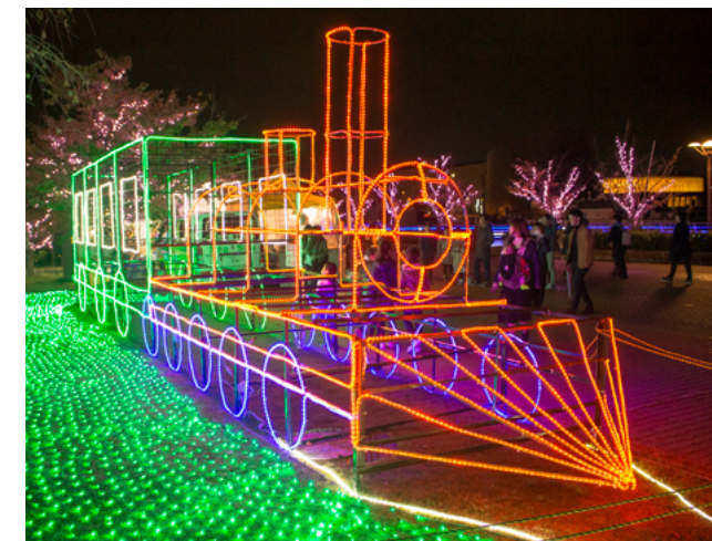
金ヶ崎緑地に設置された蒸気機関車のオブジェ

防災意識を高めるため、敦賀市総合防災訓練が気比中学校で行われました。この日は、北、南、東浦地区の住民をはじめ、関係団体を含めて約800人が参加。初期消火やはしご車搭乗などの体験型ブースや、福井県警のレスキュー車などの展示ブースが設けられ、多くの家族連れで賑わいました。また、避難所開設・運営訓練や防災ヘリコプターによる救出訓練が行われ、地域防災力の向上と防災関係機関の連携を強化しました。