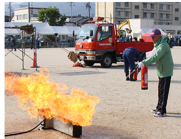
初期消火を体験する参加者