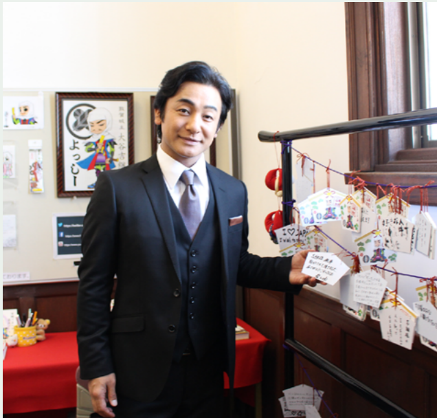
みなとつるが山車会館では絵馬に吉継公へのメッセージをいただきました