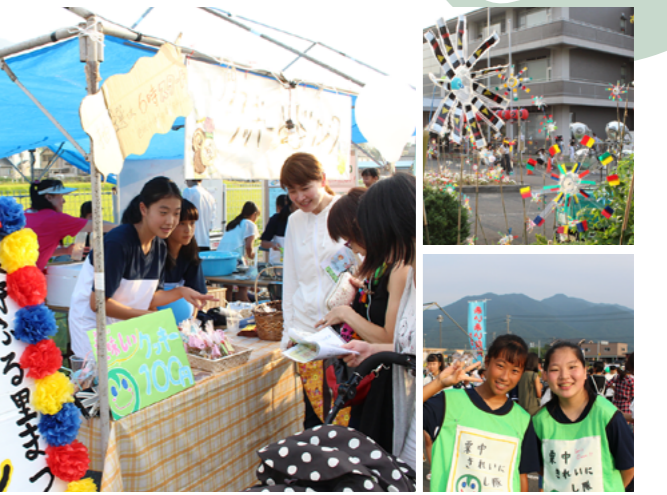
ブースの様子(左)会場を彩る風車と清掃ボランティアの中学生(右)

第54回敦賀地区自衛消防隊操法大会が、市公設地方卸売市場の駐車場で行われました。各地区や事業所から83チームが参加。消火栓、小型動力ポンプや屋内消火栓の部に分かれ、消防操法にかかる時間や確実性などを競いました。強い日差しが降り注ぐ中、隊員たちは日ごろの訓練の成果を発揮しようと、汗だくになりながら全力で取り組んでいました。機敏に動く隊員たちの姿に、観客から大きな拍手が送られました。