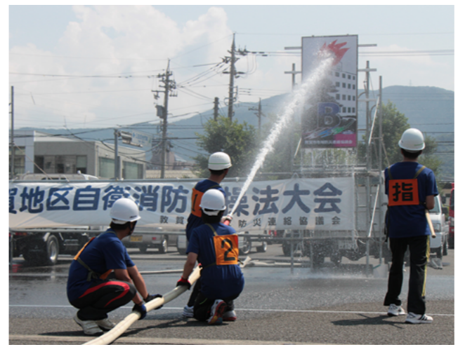
火に見立てた標的に放水する隊員たち

あなたが写っていたらご連絡ください。写真を差し上げます。 〈秘書広報課 ☎22-8112〉