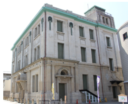
▲今回指定される市立博物館

地上3階、地下1階の建物は、外観の1階部分は西欧の古典的な意匠、2・3階は簡素で近代的な意匠とし、半円アーチのひさしを設けるなど