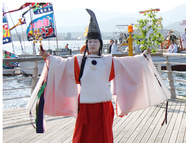
華やかな舞を奉納する「白拍子」

認知症の理解を深めるため、認知症の方や家族、地域住民の方々がタスキをつないで日本を縦断する「RUN 伴 2016」が敦賀市で初めて開催されました。この日は、市内のランナー約10人が参加。松原運動場を出発し、市役所前や氣比神宮前など市内各地を走り、認知症になっても安心して暮らせる地域づくりを呼びかけました。ランナーたちの一生懸命走る姿に沿道からは大きな声援が送られました。