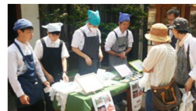
▲修学旅行先でのふるさとPR活動