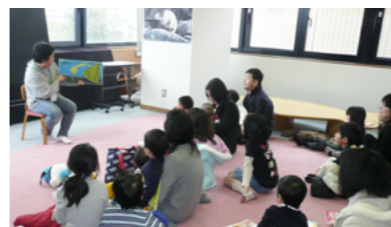
▲図書館「おはなし会」

● 福井団体の開催により得られた成果や知見等をさらなるスポーツ振興に活用 ● 生きがいや健康づくりとして、生涯にわたり豊かなスポーツライフが送れる環境づくりを推進