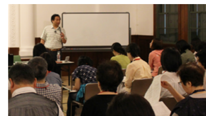
▲博物館「吉継カフェ」