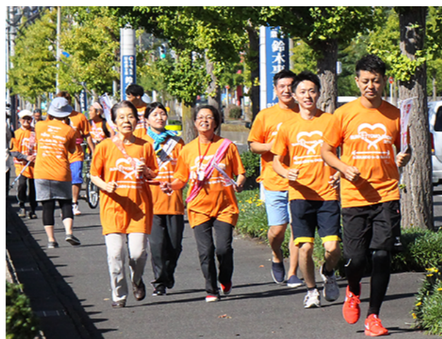
市役所前を走るランナーたち

あなたが写っていたらご連絡ください。写真を差し上げます。 (秘書広報課 ☎ 22 - 8112)