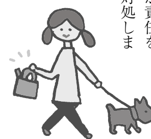
▲散歩の際には袋を忘れずに

必要なしつけを行う、散歩に行くときは、袋や水を入れたペットボトルを持参し、フンは持ち帰る、尿は洗い流すなど、飼い主が責任をもって対処しましょう。