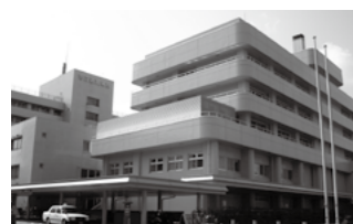
①表彰を受ける米島院長(左) 平成28年度は敦賀病院を含めて12病院が受賞。 ②市立敦賀病院は地域包括ケア病棟を設置するなど、地域のニーズに合った医療の提供を目指しています。

市立敦賀病院は、地域医療の確保に重要な役割を果たし、経営の健全性が保たれているとして、平成28年度の自治体優良病院の表彰を受けました。同表彰は、全国自治体病院開設者協議会などが全国の自治体立の病院から表彰しており、福井県からは17年ぶりの表彰となります。