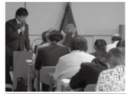
DV被害者支援専門研修会