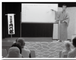
男女共同参画推進講座

「こんなことに気をつけてほしい」性別で役割分担を決めず、その人らしさを尊重しましょう。