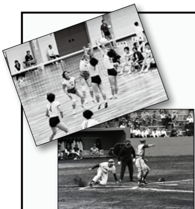
昭和43年の福井国体。敦賀市は、バレーボール、軟式野球の会場でした。

敦賀市では、国体競技として「水泳(競泳)、卓球、軟式野球、ソフトボール、弓道(近接、遠接)、空手道」、大会競技として「水泳、フットベイスポール」が実施されます。福井しあわせ元気国体・大会を市民総参加で盛り上げるために、今月号から「はぴねすニュース」の連載をスタートします。