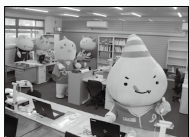
4月1日、国体推進課事務所が敦賀市総合運動公園体育館内に新設されました。

今後、開催競技の詳しい紹介やイベント情報をはじめ、各地区、団体の取り組みの追跡や競技観戦の見どころなどを大解析していきます！