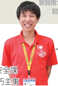
生活安全課 鑑継 巧主事

乗って守ろうバス交通！ たまにはバスを なるべくバスを。 敦賀市を含め、全国的に路線バスの利用者は減少傾向となっています。利用者の減少は、バス路線の廃止につながります。将来に向けて生活の足を残すためにも、積極的にコミュニティバスをご利用ください！