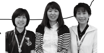
健康推進課の歯科衛生士

A.私たちは、乳幼児から高齢者への歯の健康教室や歯科相談を通じて、お口の健康づくりをサポートしています。お口の健康は、からだの健康! 気軽にご相談ください。