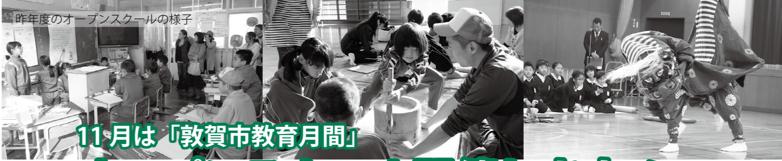
昨年度のオープンスクールの様子