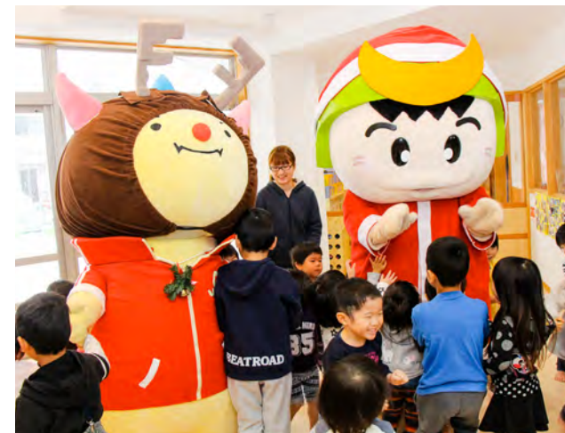
園児たちと交流するツナガ君サンタとはびりゅうトナカイ

氣比神宮大鳥居に保存修理工事のために取り外されていた扁額が再び取り付けられました。保存修理工事は、昭和62年以来、約30年ぶりに行われ、1年間かけて大鳥居の漆の塗り替えなどを行いました（平成29年12月30日竣工）。塗り終わった直後の大鳥居は光沢のある濃い朱色ですが、日光を浴びることで漆成分が分解されて光沢がなくなり、徐々により明るい色に変化していきます。