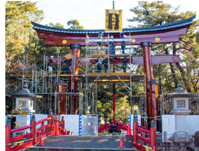
漆の塗り替えが終わった大鳥居に扁額を取り付けている様子

12月6日、原子力機構がもんじゅの廃止措置計画認可申請書を原子力規制委員会に提出しました。計画では、2022年度までに原子炉から燃料取出しを完了し、順次解体撤去を進め、2047年度に廃止措置を完了するとしています。