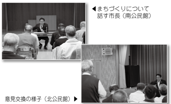
意見交換の様子(北公民館)▶