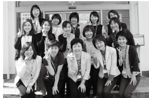
▲「健康センターはぴふる」の保健師、助産師、看護師