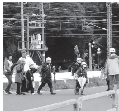
▲児童の登校を見守る民生委員

民生委員児童委員は、それぞれの担当区域において活動しています。日々の生活をする上で、心配ごとや不安などがあるときは、お近くの民生委員児童委員へご相談ください。(お住まいの地区の委員を知りたい方は地域福祉課へご連絡ください)