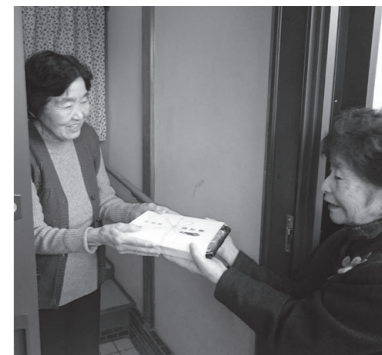
▲ひとり暮らしの方へ年越しそばを手渡す民生委員