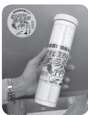
▲救急医療情報キット

一人暮らしの高齢者の方などを対象に、万一の救急時に備え、かかりつけの医療機関や服薬内容などの情報を収めておく救急医療情報キットを配布しています。