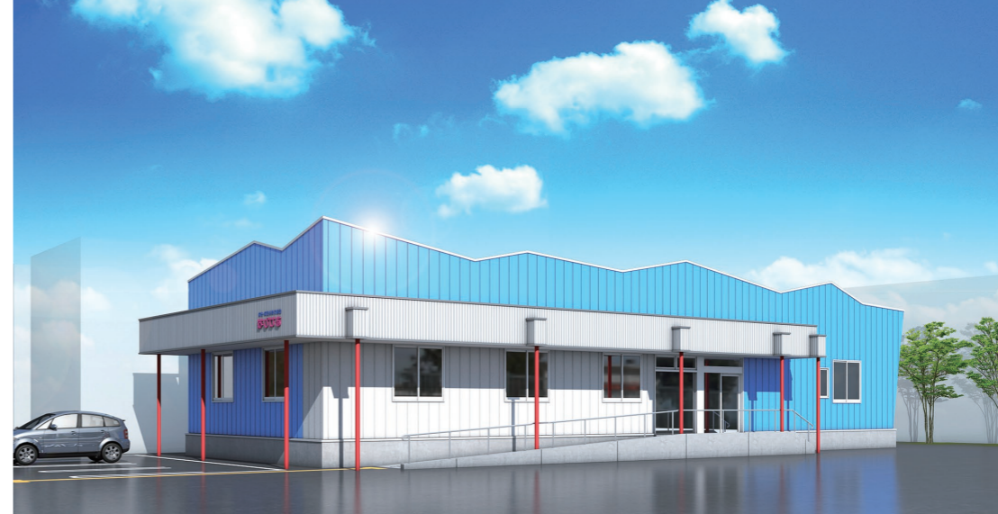
▲4月8日(月)に開設する「はぴけあ」のイメージ図