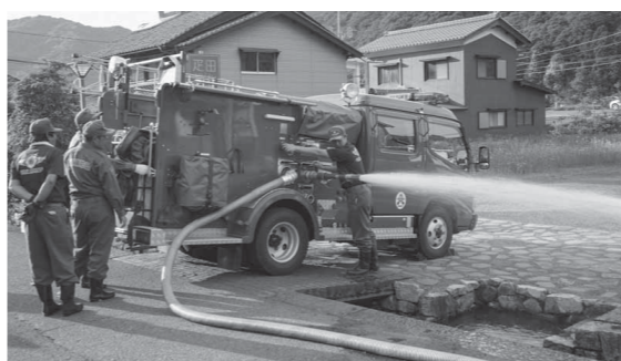
愛発分団が日曜日の夕方に定期的に行っている放水訓練の様子