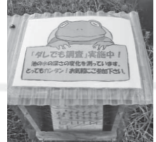
▲カエルの看板が水位の観測地点の目印。

湿地にとって何よりも大切な「水位」の状況を把握するためのモニタリング調査で、誰でも参加できます。調査項目は中池見にある笹鼻池の水位と湿地の地下水位。観測地には測定方法や記録用紙などを設置しています。モニタリングは湿地のいわば健康診断。日々変わる湿地の状態を把握するために、調査にご協力ください。