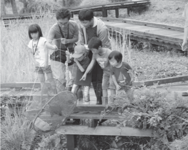
▲中池見にいるカメをみんなと協力して探し出します。

とき 8月5日(日) 9時～12時 対象 小中学生 ※小学3年生以下は保護者同伴 定員 15人(要申込、先着順) 参加費 500円