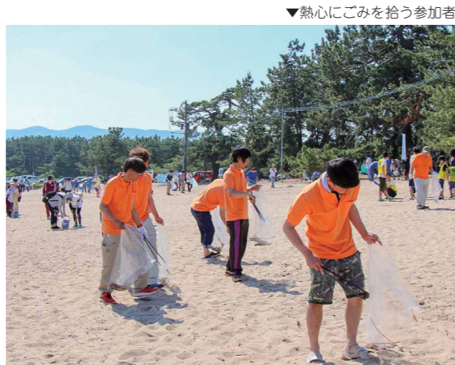
▼熱心にごみを拾う参加者