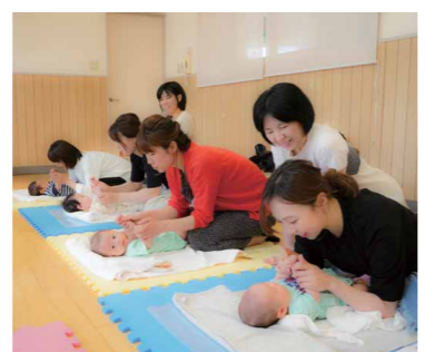
▲ベビーマッサージの様子（毎月第2・4木曜日に開催）

生後2〜4カ月の赤ちゃんとお母さん向けのセミナーです。助産師からベビーマッサージを教わりながら、赤ちゃんとの