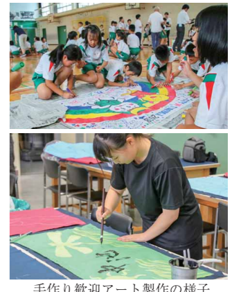
手作り歓迎アート製作の様子

心温まるおもてなしで迎えするため、手作り歓迎アートの制作を行っています。市内小学校の児童による「メッセージ横断幕」、市内高校美術部、書道部の生徒による「手作りフラッグ」と「ガラスアート」。これらの作品の披露・贈呈式を行います。心のこもった作品をぜひご覧ください。