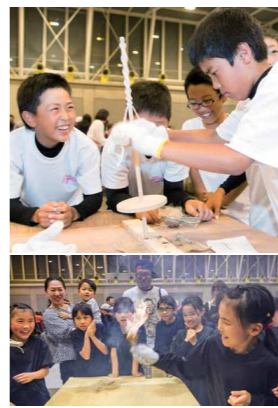
採火イベントでの火おこしの様子

また、「敦賀市の火」の炬火名の募集を行ったところ、市民から555作品の応募をいただきました。この中から選ばれた炬火名を、敦賀高校書道部の書道パフォーマンスとともに発表します。