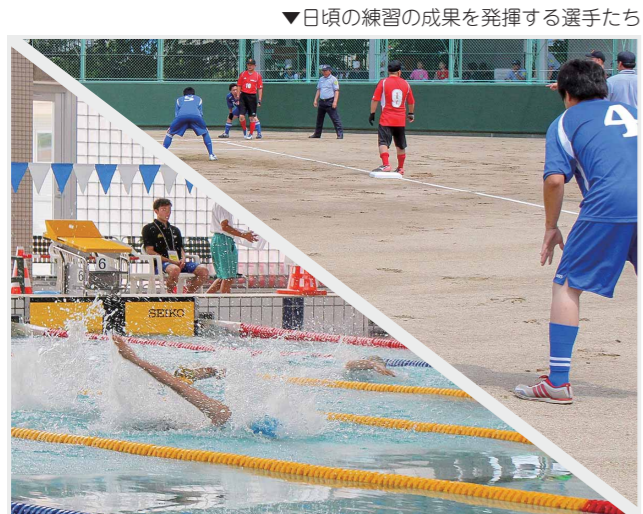
▼日頃の練習の成果を発揮する選手たち