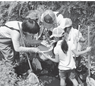
▲水中の生き物をたも網を使って観察します。