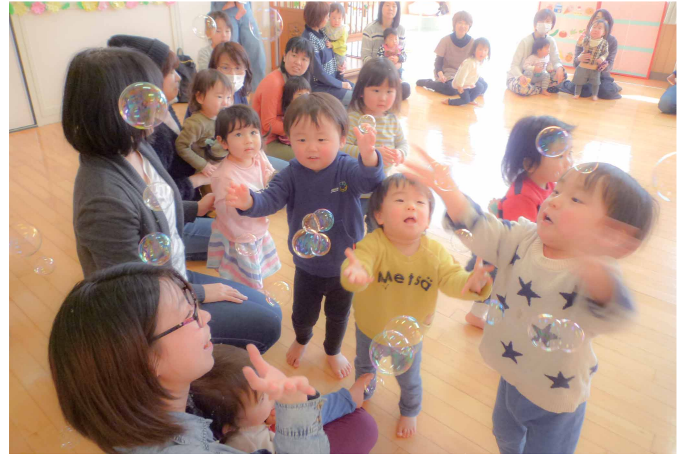
▲子育てひろばの様子（子育てひろばは開所中いつでも利用できます）

も、先が分からず、不安になることもあります。講座で子育てについて学び、今後の成長過程のイメージを持つことで、安心して子育てすることができます。