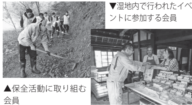
▼湿地内で行われたイベントに参加する会員