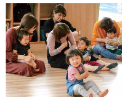
▲親子で一緒に遊ぶ「手遊び」の様子（平日11時〜、土曜日10時45分〜開催）

0〜3歳くらいのお子さんに合った遊具やおもちゃを使って、明るく清潔な広場で遊べます。他の子どもとふれあうことで、子どもたちの笑顔も増え、ママやパパの気持ちも明るく軽くなります。利用者からは「たくさん遊ぶと、ごはんをよく食べ、ぐっすりお昼寝します」と好評です。子どもに一日の生活リズムができる、ママやパパ自身にも気持ちのゆとりができます。