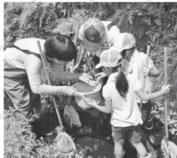
▲水中の生き物をたも網を使って観察します。