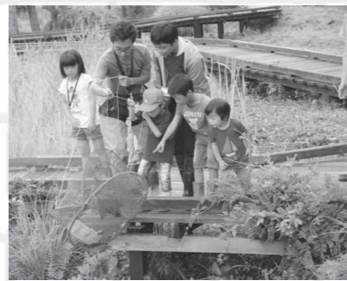
▲中池見にいるカメをみんなと協力して探し出します。