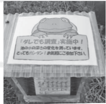
▲カエルの看板が水位の観測地点の目印。

湿地にとって何よりも大切な「水位」の状況を把握するためのモニタリング調査で、誰でも参加できます。調査項目は中池見にある笹鼻池の水位と湿地の地下水位。観測地には測定方法や記録用紙などを設置しています。モニタリングは湿地のいわば健康診断。日々変わる湿地の状態を把握するために、調査にご協力ください。