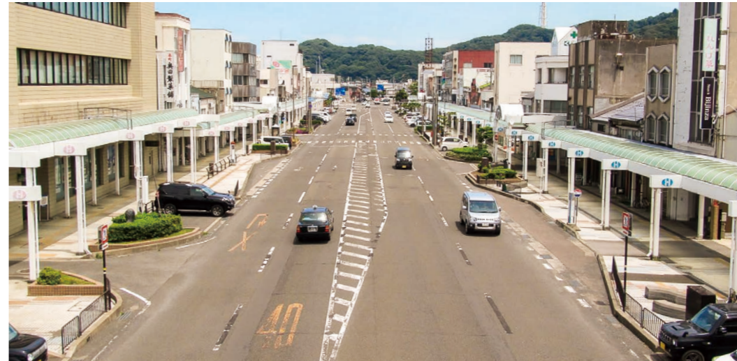
整備後の道路イメージ ※本町1丁目側 (片側1車線の2車線)