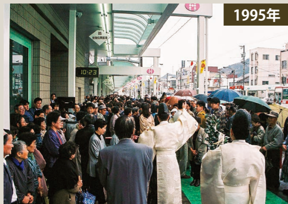
▲リニューアルした本町1丁目アーケードの完成式