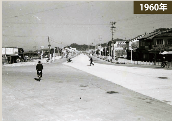
▲白銀交差点から本町方面を望む