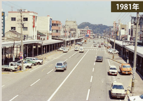
▲アーケードが設けられた頃の本町通り