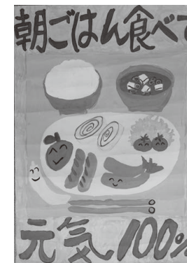
松原小5年 稲葉 大地