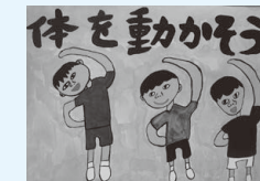
栗野南小4年 田中 琉空