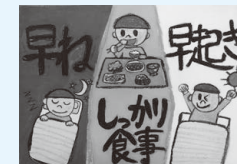
栗野南小4年 清水 大雅