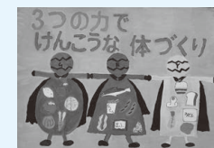
松原小4年 辻 惟千夏