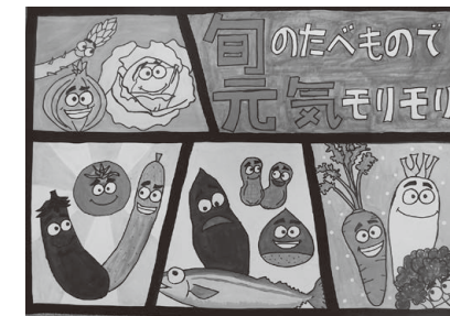
松原小6年 竹中 菜結