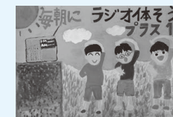
松原小5年 立花 正淳