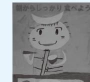
栗野南小4年 山本 悠生