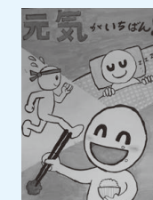
松原小4年 岸内 蒼空