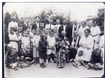
▲寄贈された写真のひとつ。中央では、ポーランドと日本の子どもが握手をしている