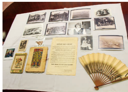
▲今回寄贈された資料の一部