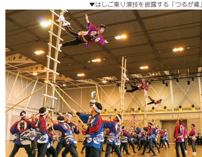
▼はしご乗り演技を披露する「つるが鷹」

あなたが写っていたらご連絡ください。写真を差し上げます。 (秘書広報課 ☎ 22-8112)