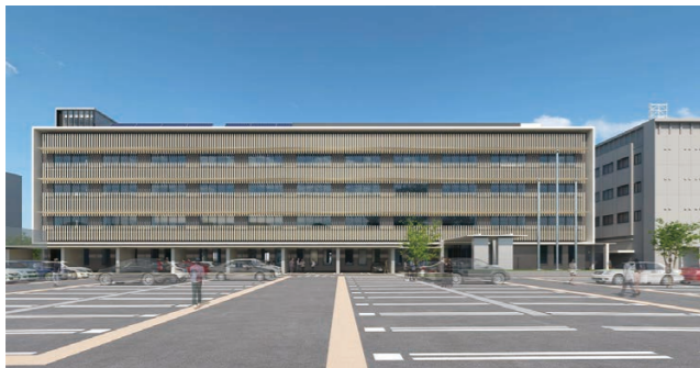
▲新庁舎の外観イメージ（南面）