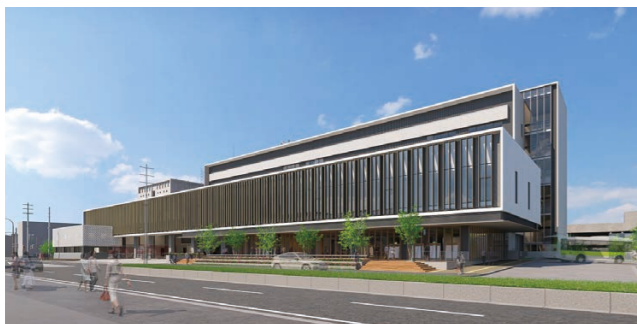
▲新庁舎の外観イメージ（北面）