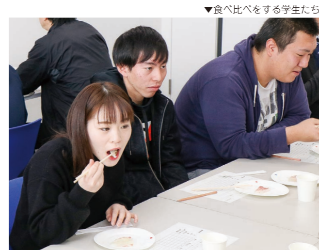
▼食べ比べをする学生たち