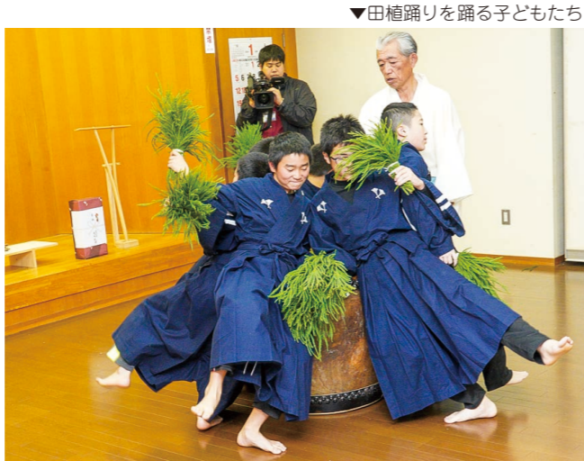
▼田植踊りを踊る子どもたち