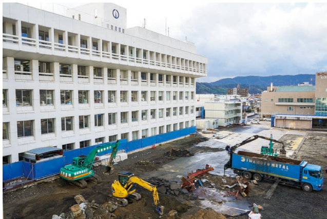
▲新庁舎の建設が進められている市役所前の様子

新たな敦賀市庁舎と敦賀美方消防組合消防庁舎の建設工事が1月22日から始まりました。新庁舎は、市庁舎と消防庁舎を一体的に建設し、免震構造と連結制震構造を採用することで防災拠点としての機能強化を図ります。また、利用の多い窓口の1階フロアへの集約や、誰もが使いやすいユニバーサルデザインを採用することで、市民が利用しやすい庁舎を目指しています。新庁舎は令和2年度末の完成を予定しており、その後、現庁舎の解体と駐車場などの整備を行います。