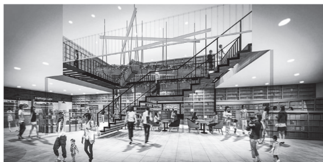
▲多数の書籍やカフェを備えた「知育をテーマにした公共施設」の整備イメージ（丸善雄松堂（指定管理者候補者）提案）

かれており（4頁位置図参照）、「宿泊施設、飲食・物販施設、知育をテーマにした公共施設及び公園など」で構成されています。現在の計画では、観光客らが宿泊する141室のホテルを整備し、公園と有機的に連携した中低層の飲食・物販施設などを分棟配置します。