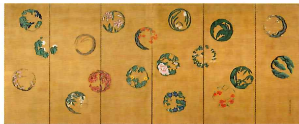
【表面左上から時計回りに】狩野雅信「菊花園」(後期展示)/長沢蘆雪「紅葉狗子図」(後期展示)/岸駒「猛虎図」(後期展示)/原在中「富士三保松原図」(後期展示)/土佐光起「伊勢図」(後期展示)/円山応挙「狗子図」(前期展示) 【裏面】1. 原在中「山州嵐山真景図」(前期展示) 2. 松村景文「月・山桜小禽・山茶花鶴鷄図」(前期展示) 3. 円山応挙「狗子図」(前期展示) 4. 長沢蘆雪「紅葉狗子図」(後期展示) 5. 森山仙「藤下遊猿図」(中期展示) 6. 初代橋本長兵衛「仙人図(等高図)」(中期展示) 7. 岸礼「百福図」(後期展示) 8. 岸恭「四季花卉図屏風」(後期展示) 9. 土佐光孚「花丸文様屏風」(中期展示)