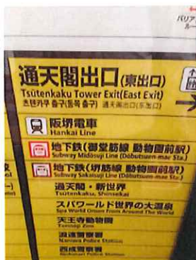
通天閣出口 (東出口)