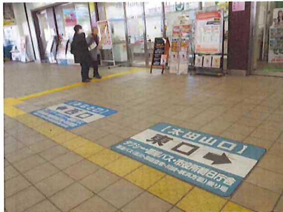
みなと口 (西口) 太田山口 (東口)