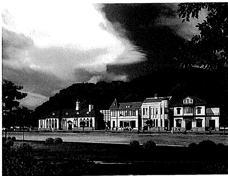
参考：復元4棟の外観イメージ図

J・FUNDING を通じて世界中、外国人の方からも資金を募ることで、国境を越えて世界にプロジェクトを広めていきます。