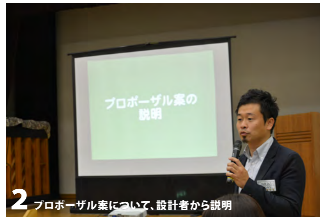
2 プロポーザル案について、設計者から説明