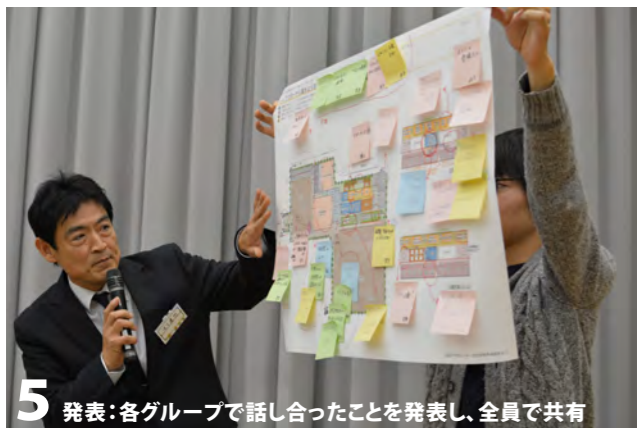
5 発表: 各グループで話し合ったことを発表し、全員で共有