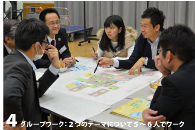
4 グループワーク: 2つのテーマについて5~6人でワーク