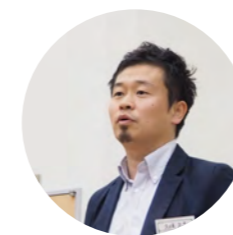
久保 久志 設計者 東畑建築事務所