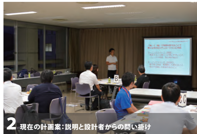
2 現在の計画案:説明と設計者からの問い掛け