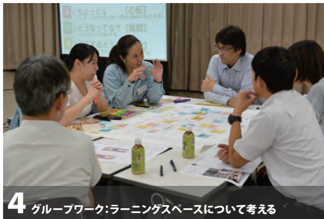
4 グループワーク:ラーニングスペースについて考える