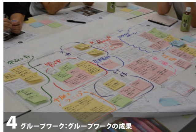
4 グループワーク:グループワークの成果