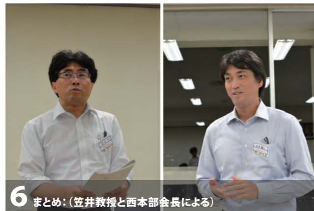
6 まとめ:(笠井教授と西本部会長による)