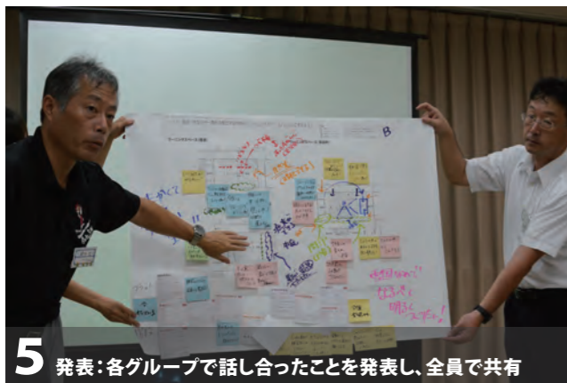
5 発表:各グループで話し合ったことを発表し、全員で共有