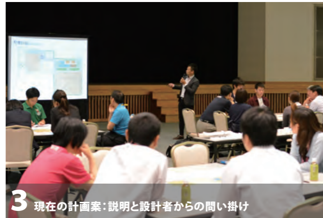
3 現在の計画案:説明と設計者からの問い掛け