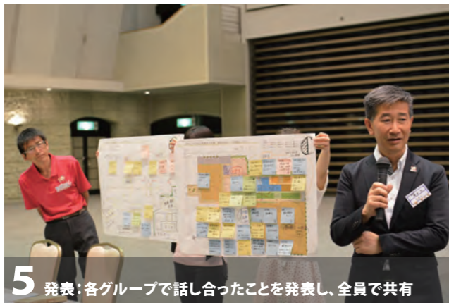
5 発表:各グループで話し合ったことを発表し、全員で共有