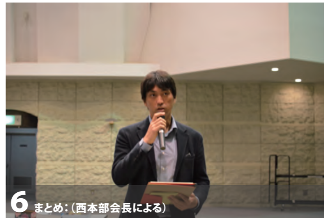
6 まとめ:(西本部会長による)