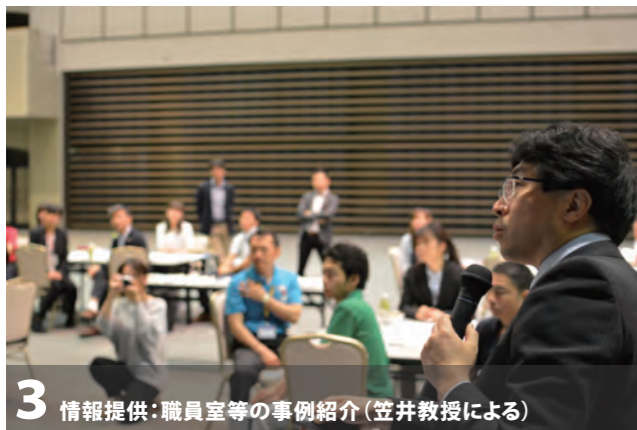
3 情報提供:職員室等の事例紹介(笠井教授による)