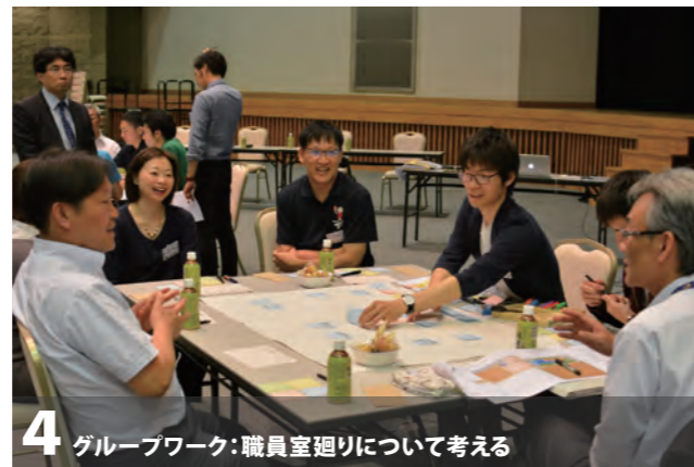
4 グループワーク:職員室廻りについて考える