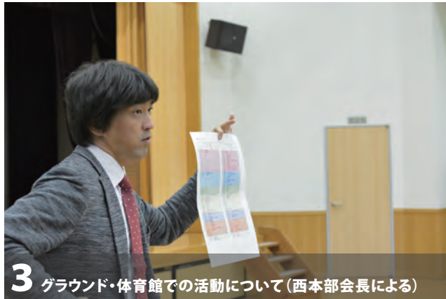
3 グラウンド・体育館での活動について(西本部会長による)