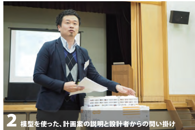
2 模型を使った、計画案の説明と設計者からの問い掛け