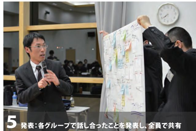
5 発表:各グループで話し合ったことを発表し、全員で共有