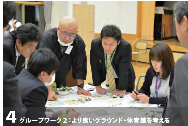
4 グループワーク2:より良いグラウンド・体育館を考える