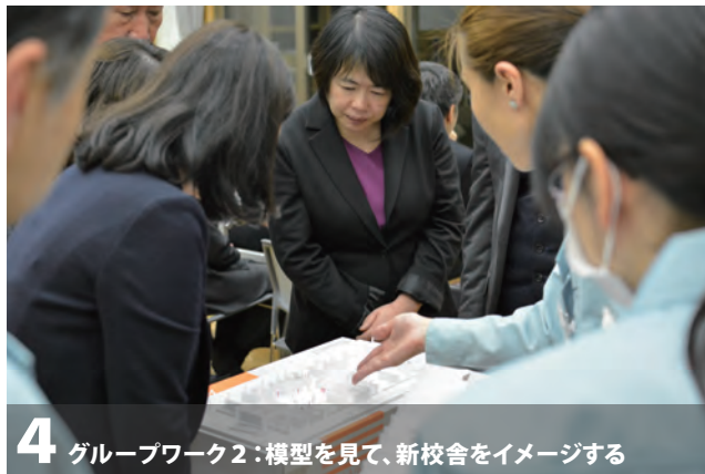
4 グループワーク2:模型を見て、新校舎をイメージする