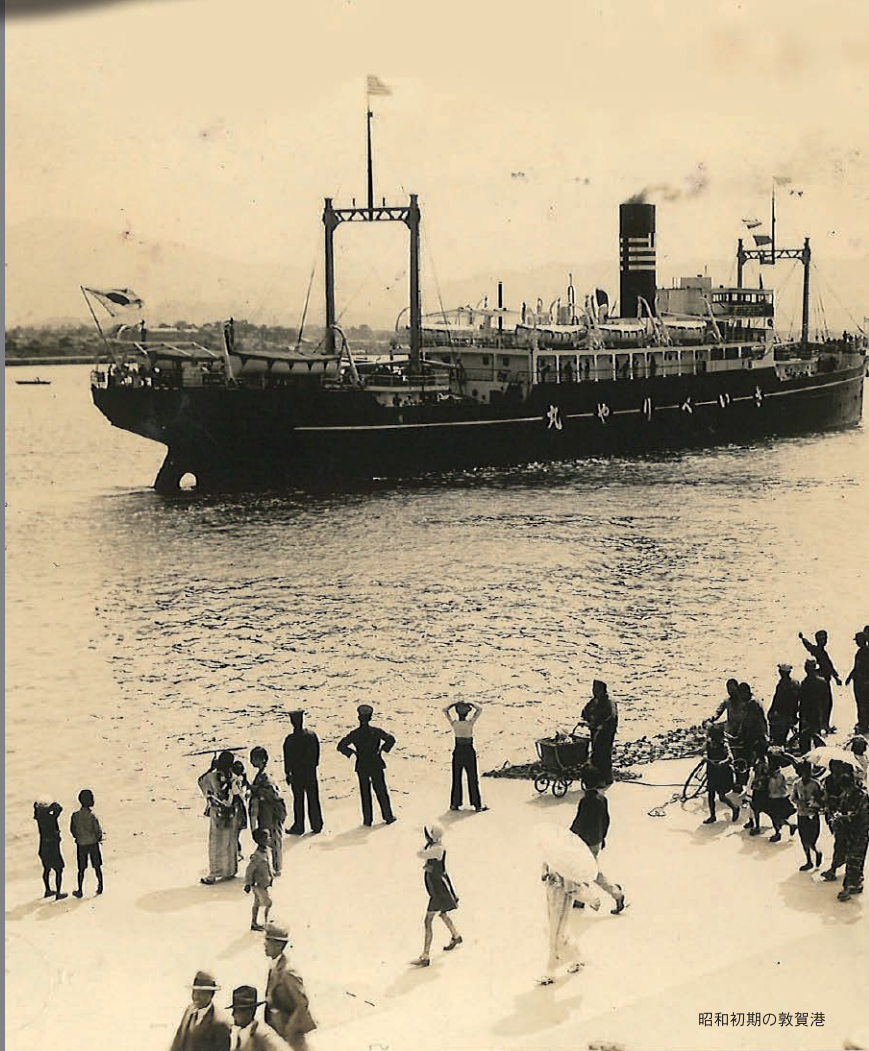
昭和初期の敦賀港