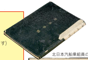
北日本汽船乗組員の船員手帳