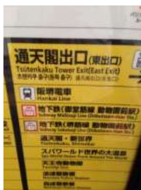
通天閣出口（東出口）