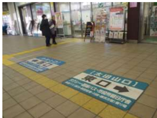
みなと口（西口） 太田山口（東口）