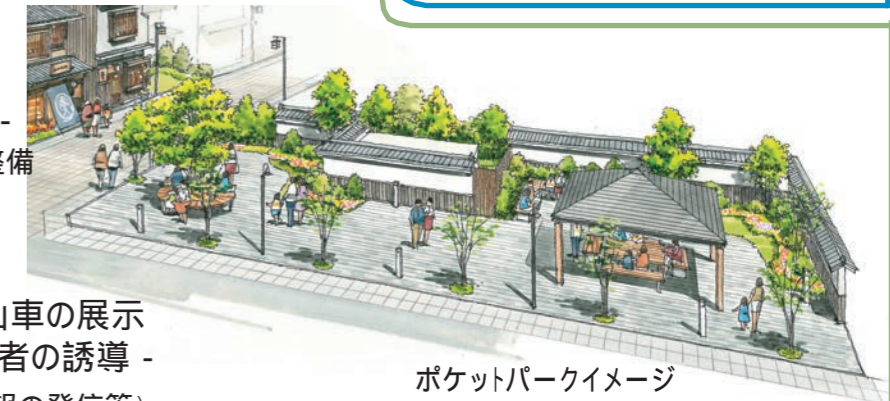
ポケットパークイメージ

その他活性化支援(ふるさと創造プロジェクト) レンタサイクルステーションの設置 まちあるきマップの作成等による継続的な広報活動 既存ストックとの活用・連携