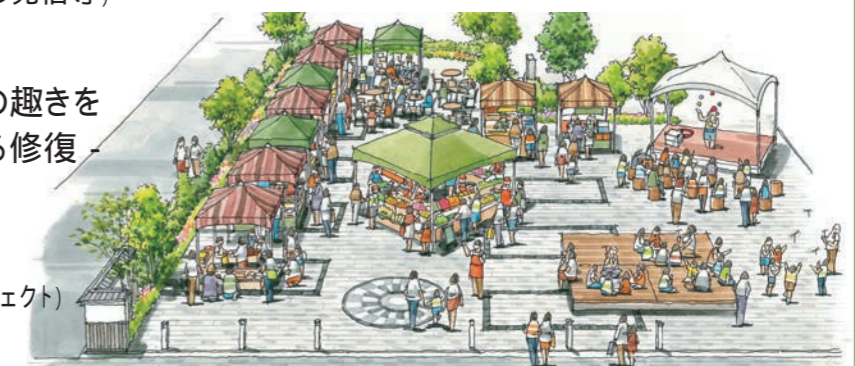
市営住宅地跡整備イメージ