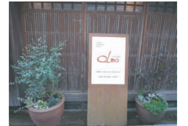
季節感のある寄せ植え