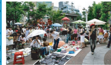
住民イベントのイメージ