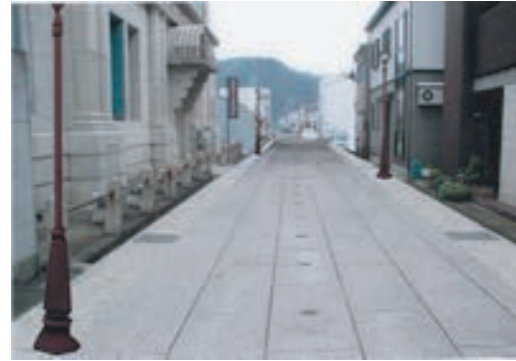
博物館通り街路高質化イメージ