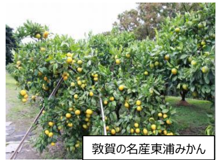
敦賀の名産東浦みかん