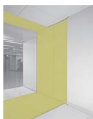
免震エキスパンション金物イメージ