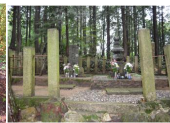
大谷吉継の墓 左は湯浅五助の墓