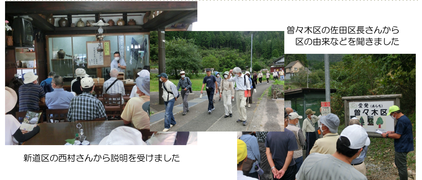
曾々木区の佐田区長さんから 区の由来などを聞きました