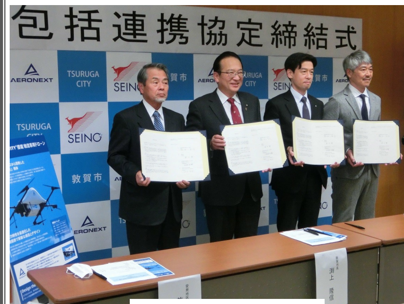
4者による公式発表の様子

これからも、最先端の技術を取り入れ、地区の生活の利便性に役立つよう取り組んでいきます。