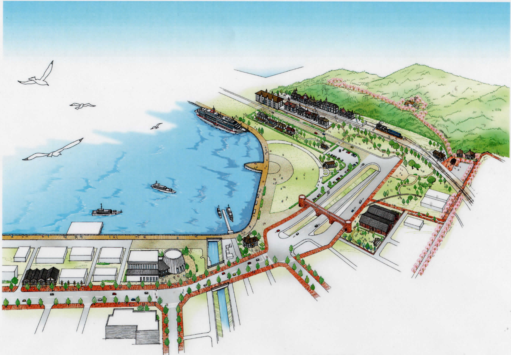
金ヶ崎周辺整備構想 ~敦賀ノスタルジウム~ 将来イメージ図