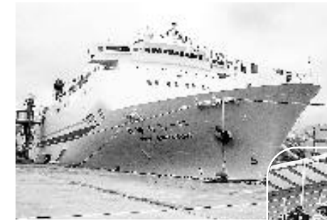
敦賀・新潟・秋田・苦小牧フェリー就航 (7/12)