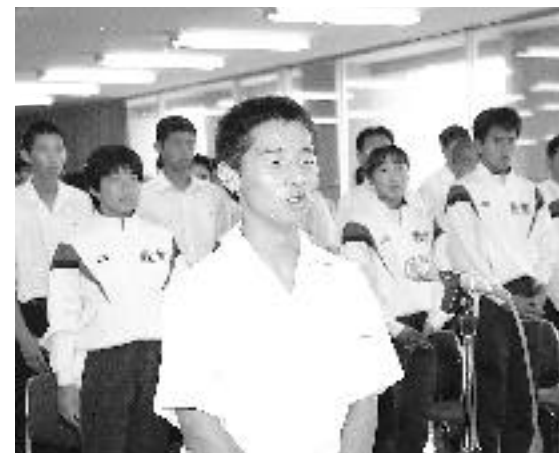
インターハイ等全国大会壮行式 (7/16)