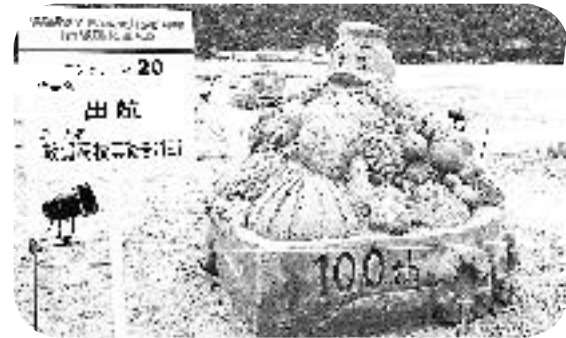
ウォーターパラダイスインワカサ (7/23)