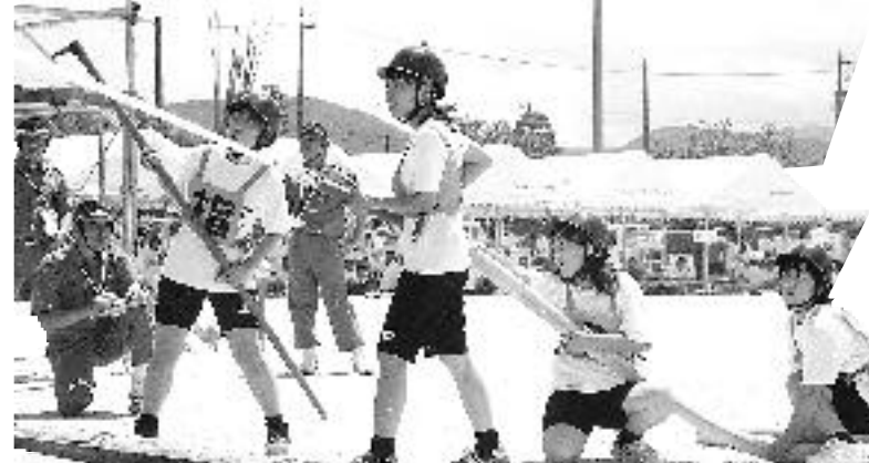
敦賀地区自衛消防隊操法大会 (8/1)