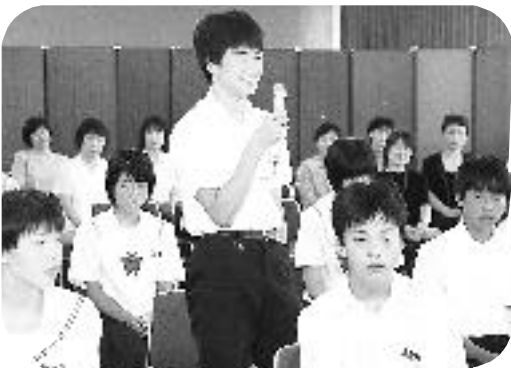
中学校生徒海外派遣研修 (7/28)