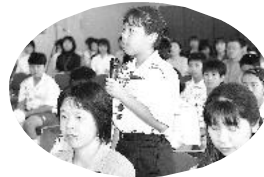
訪口・訪韓児童親善使節団 (7/16)