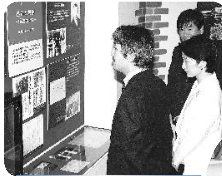
秋篠宮殿下・同妃殿下来敦 (7/22)

この日、海の祭典のため来敦された秋篠宮殿下と同妃殿下は、市民らの熱烈な歓迎を受けました。また、みなと博会場のきらめきみなと館をご視察されました。