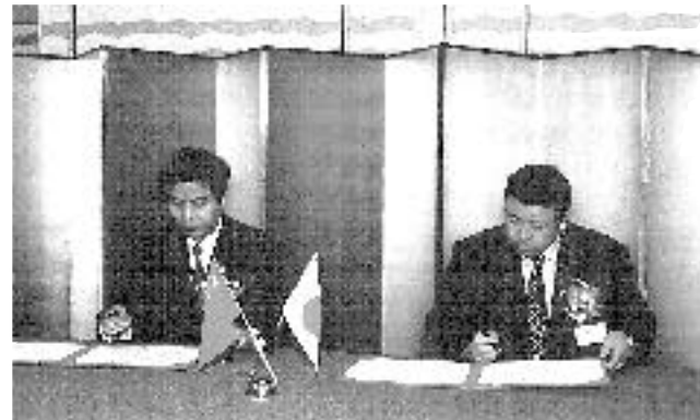
台州市友好協 議書調印 (7/23)