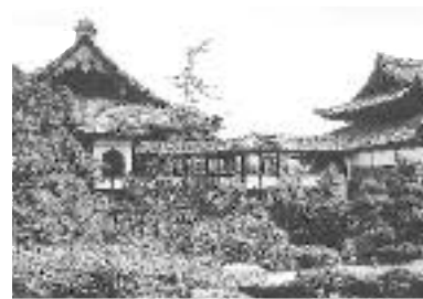
西福寺の阿彌陀堂(右)と御影堂(左)