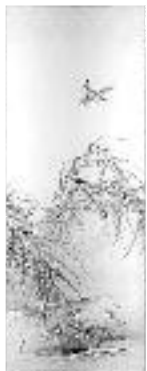
ほうじょうせきいげ 豊稜鶴鶴図 1幅

今回はそれら館蔵の棟嶺作品を中心に、その師弟、関連の流派の作品もあわせて展示いたします。伝流的な技法に根ざした日本画の優れた世界に親しんでください。