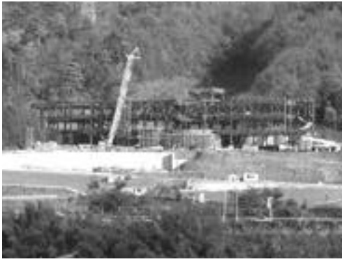
建設が進む市民温泉施設