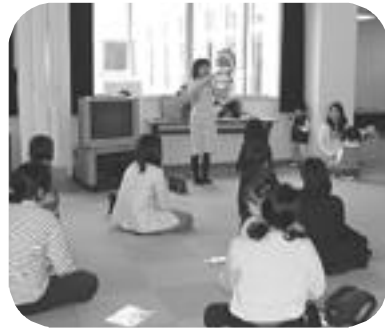
歯の健康セミナー