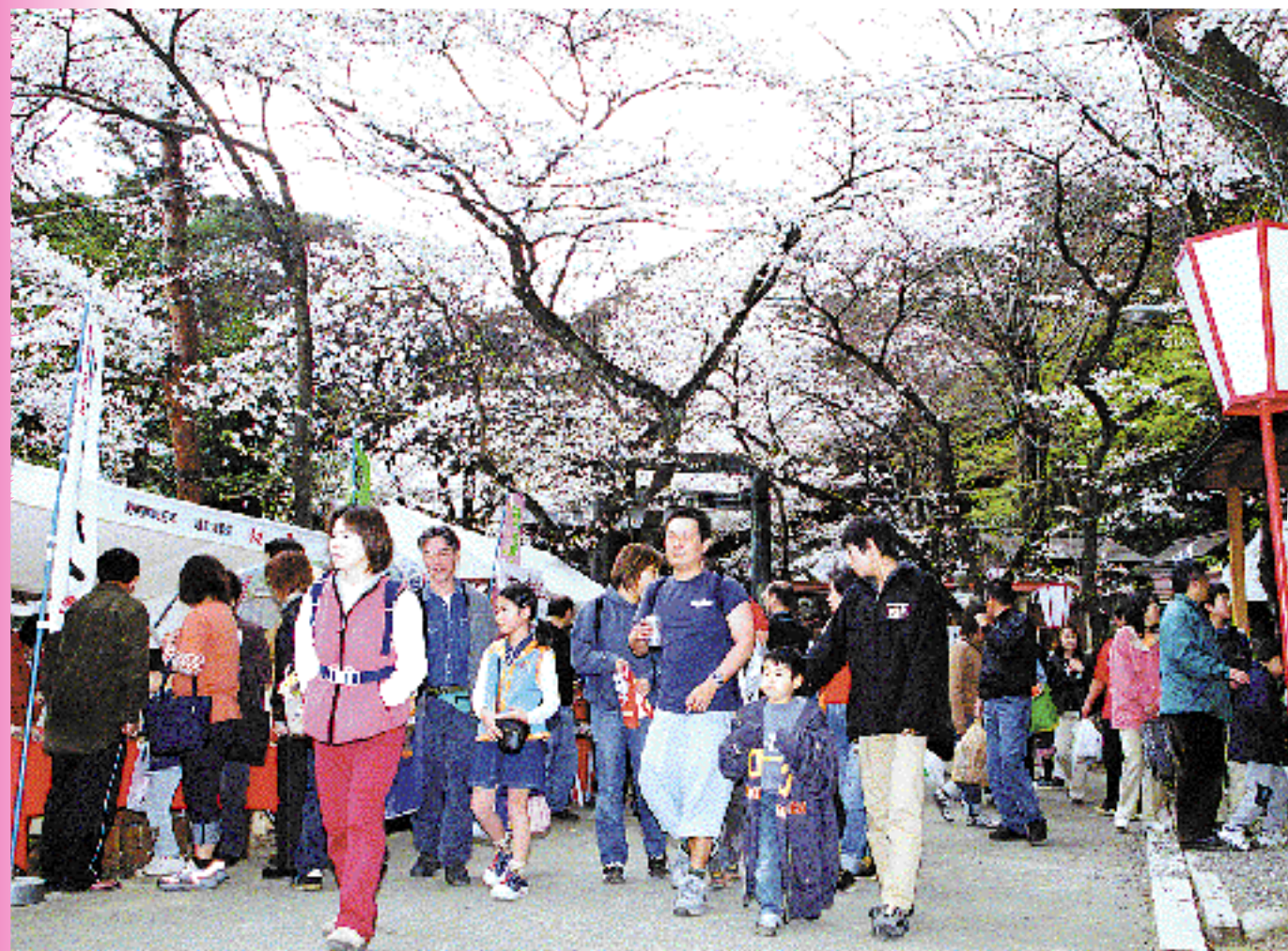
花換まつり(金崎宮) 3月27日~4月15日