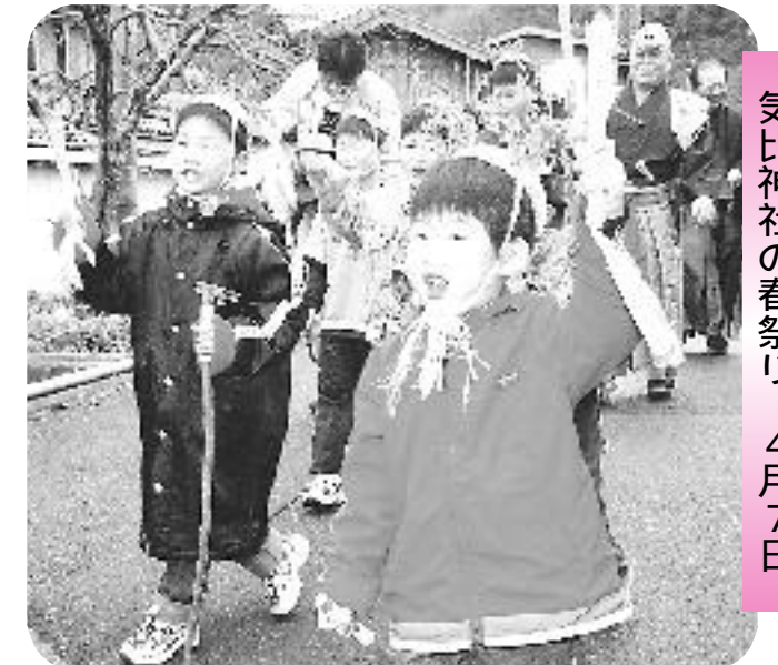
気比神社の春祭り 4月7日

刀根区で、豊作を願う伝統行事「気比神社の春祭り」が行われました。7人の子どもたちが笠をかぶり、手にはほうきと杖を持ち、区内を練り歩きました。「オーッ」の元気な掛け声に春風も微笑んでいました。