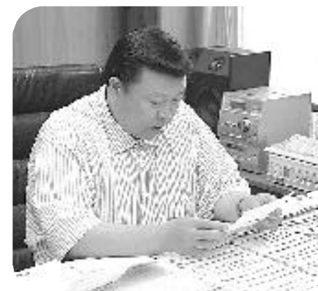
昨年のメッセージ開封の様子

寄せられたメッセージは、市長自ら目を通し、建設的なご提案等については「広報つるが」「行政チャンネル」においてお答えします。なお、集計結果についても、「広報つるが」に掲載します。