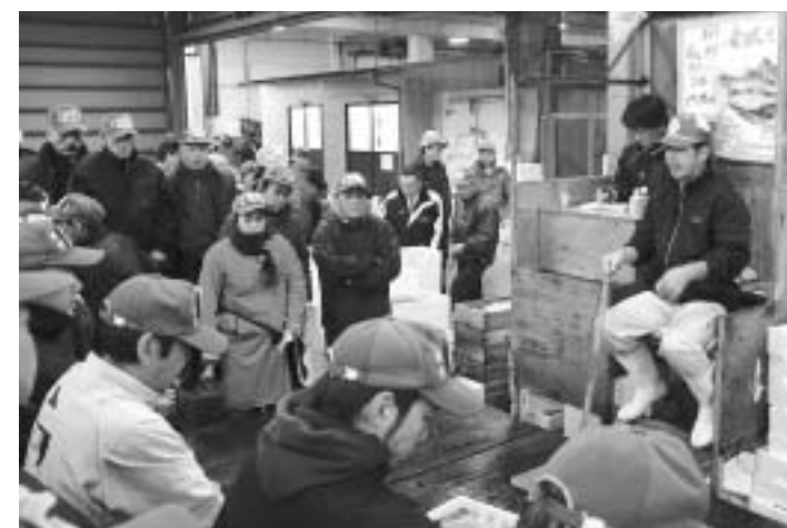
今年も威勢よく競り人の声が響きます