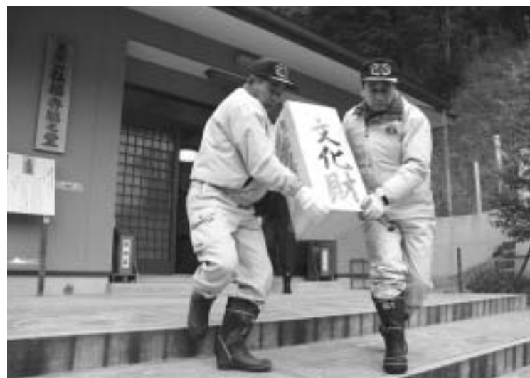
文化財に見立てた箱を運び出す訓練参加者