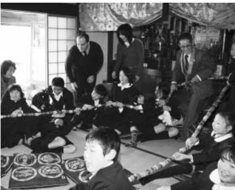
一生懸命数珠を引く子どもたち

まず大人の男性、大人の女性、常宮小児童の順に数珠回しを数回行った後、大人の男性と常宮小児童の数珠の引き合いになりました。一生懸命引き合った末、今年も子どもたちに軍配が上がり、豊漁と占われました。