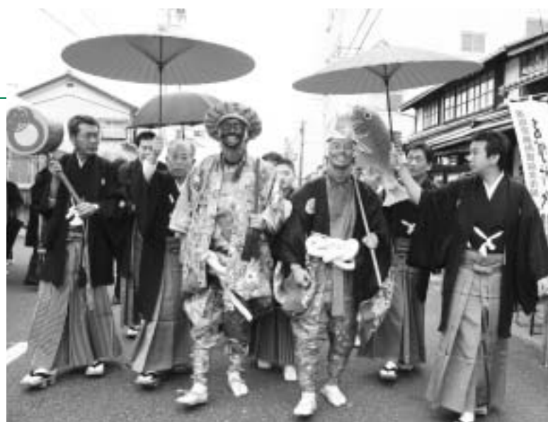
町内を巡行する大黒神（左）と夷子神（右）

国の重要無形民俗文化財に指定されている「敦賀西町の綱引」が、相生町の旧西町通りで行われました。町内の男性2人が夷子神と大黒神に扮して町内を練り歩いた後、夷子側と大黒側に分かれて綱引開始。綱が地面に下るされるやいなや、我先にとたくさんの方が綱を取り、力いっぱい引き合いました。通りを埋め尽くした観衆からは大きな声援が飛び交い、熱戦の末大黒方の勝利。4年連続で豊作と占われました。