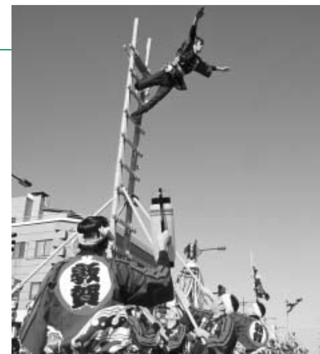
つるが鷲の見事な演技

つるが鷲の演技披露は今回で2回目。計50人の団員が参加し、様々な演技が次々と繰り出されました。見事大技が決まると、沿道につめかけた大勢の市民からは歓声と拍手が送られました。