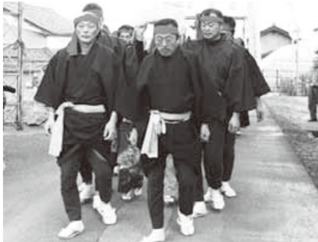
人身御供を囲んで鳥居から本殿へ向かうゴクカキ

「食」を通して敦賀のことを知ってもらい、PRしようと、JR直流化活性化・利用促進協議会が、全国から昆布とかまぼこを使った簡単レシピを募集しました。この日は河村料理学園で最終審査会が行われ、料理教室の参加者らが、一次審査を通過した3点を実際に調理、試食を行いました。その結果、かまぼこをチーズとケチャップでイタリア風にアレンジした「かまぼこイタリアーノ」が見事優秀作品に選ばれました。