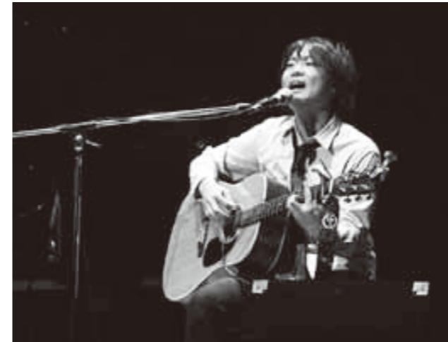
ギターの弾き語りを披露する卒業生

地球温暖化など環境問題への意識を高めようと「敦賀市環境フォーラム」が、2月28日・3月1日にきらめきみなと館で行われました。会場では、電気自動車やパネルの展示、エコファッションショーなどが行われ、訪れた方に環境保全を呼びかけました。また、環境啓発を目的とした「敦賀市かんきょうコンクール」と、3月2日からのレジ袋有料化を前に開催した「マイバッグコンクール」の表彰式も行われました。