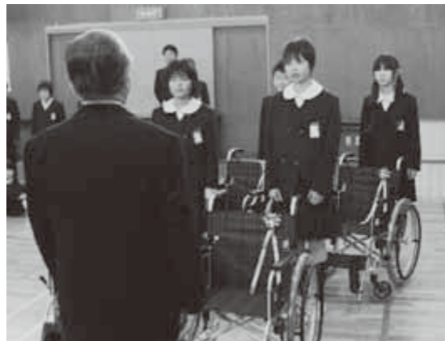
車いすを渡す生徒たち