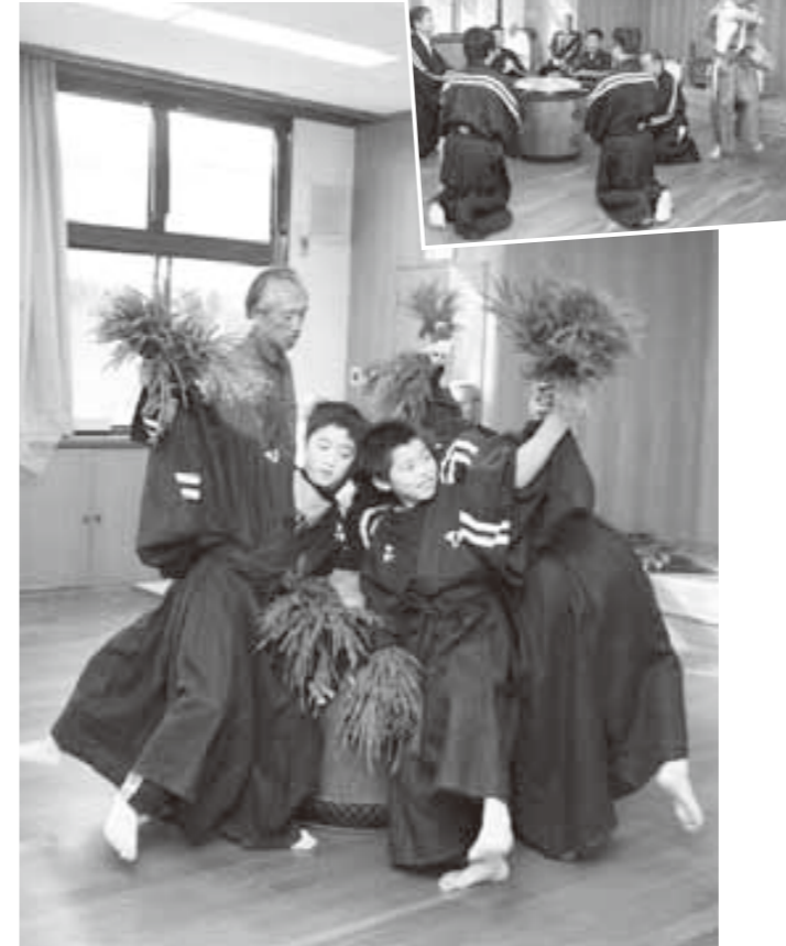
福の種をまく福男が登場