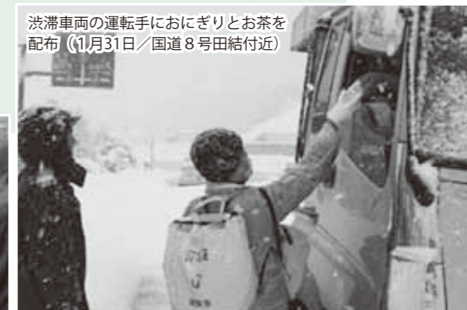
渋滞車両の運転手におにぎりとお茶を配布（1月31日/国道8号田結付近）