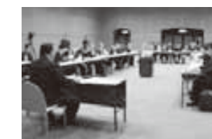
実施計画書を審議する委員

平成26年度開通予定の舞鶴若狭自動車道にスマートインターチェンジ(※)を設置しようと、関係機関との協議を進めるため、2月18日にプラザ萬象で地区協議会が開催されました。 初めてとなる今回の協議会では、設置に必要な実施計画書を策定。今後は実現に向けて具体的な手続きを進めるとともに、国への要望活動などを行っていきます。 ※スマートインターチェンジ ...ETC専用の簡易型インターチェンジ