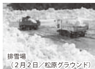
排雪場（2月2日/松原グラウンド）