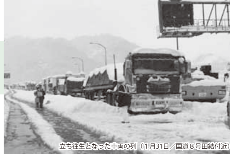
立ち往生となった車両の列（1月31日/国道8号田結付近）