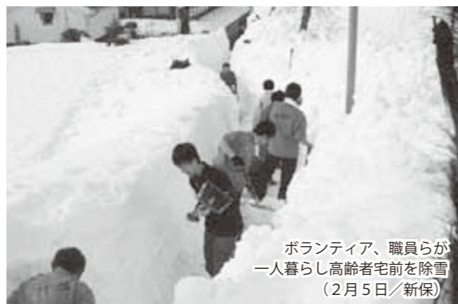
ボランティア、職員らが一人暮らし高齢者宅前を除雪（2月5日/新保）