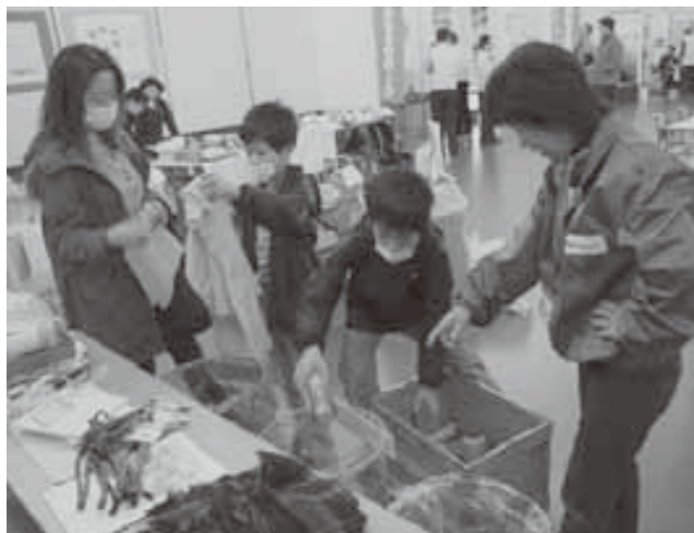
ゲームでゴミの分別を学びます