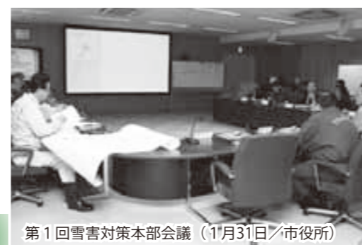
第1回雪害対策本部会議（1月31日/市役所）