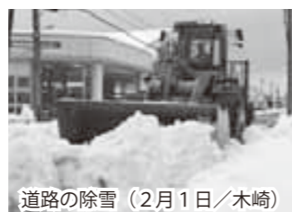
道路の除雪（2月1日/木崎）