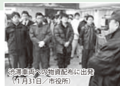
渋滞車両への物資配布に出発（1月31日/市役所）

1月30日深夜から31日午前中にかけて、平野部で約50センチ、山間部では1メートル以上の降雪となり、混乱に見舞われた市内。 一刻も早く事態を回復させようと、皆が奔走しました。