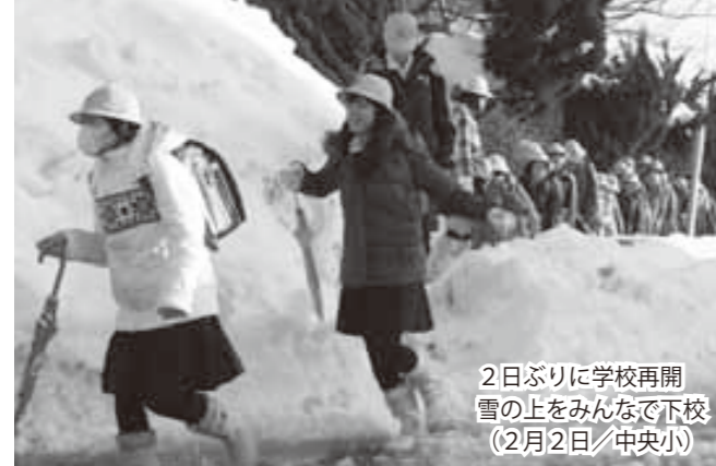
2日ぶりに学校再開 雪の上をみんなで下校 （2月2日/中央小）