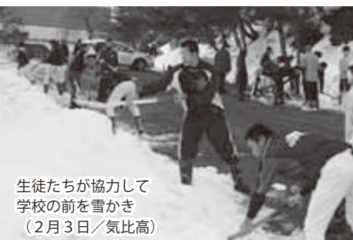
生徒たちが協力して 学校の前を雪かき （2月3日/気比高）