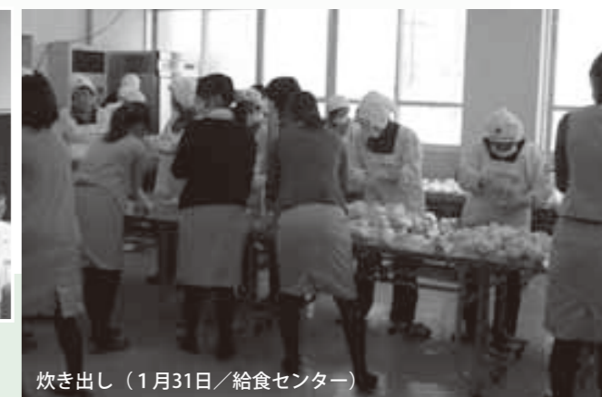
炊き出し（1月31日/給食センター）