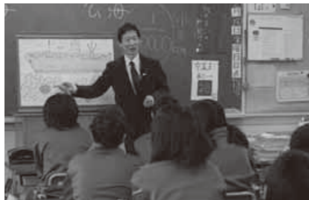
市民との交流エピソードを紙芝居を使って紹介