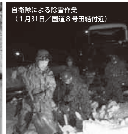
自衛隊による除雪作業（1月31日/国道8号田結付近）

ようやく降雪がおさまり、一時の混乱も徐々に落ち着き始めました。まちの人たちもほっと胸をなでおろし、家や周囲の除雪に動き出しました。