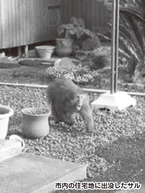
市内の住宅地に出没したサル