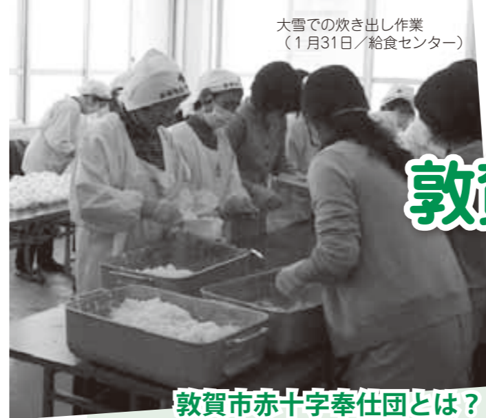
大雪での炊き出し作業 (1月31日/給食センター)