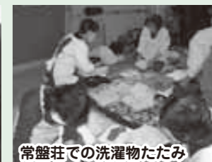
常盤荘での洗濯物たたみ

1月31日、大雪によって国道8号線で立ち往生した車のドライバーの方々に対して行った炊き出し。ここで配られたおにぎりは、敦賀市赤十字奉仕団の皆さんの協力で握られたものです。