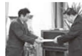
市長に答申書を手渡す会長