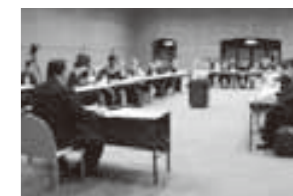
実施計画書を審議する委員

平成26年度開通予定の舞鶴若狭自動車道にスマートインターチェンジ(※)を設置しようと、関係機関との協議を進めるため、2月18日にプラザ萬象で地区協議会が開催されました。 初めてとなる今回の協議会では、設置に必要な実施計画書を策定。今後は実現に向けて具体的な手続きを進めるとともに、国への要望活動などを行っていきます。 ※スマートインターチェンジ ...ETC専用の簡易型インターチェンジ