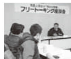
意見を交わす市長と参加者

市民と市長が気さくな雰囲気、直接意見交換をしよう場として、フリーターキング座談会が2月16日に開催されました。 参加したのは、平成22年度に新成人となった第62回敦賀市成人式実行委員の方々。市の施設に関してや、敦賀のまちについて思うことなどを話し合い、「若い人が買い物ができる場所があれば」「みんな、ふるさと敦賀が好き。このままでもいいと思う」といった若者らしい率直な意見も出ました。