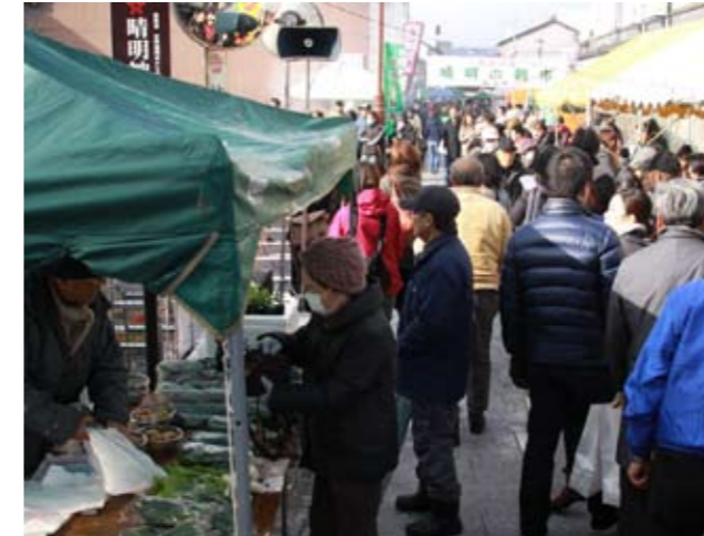
多くの買い物客で賑わう通り