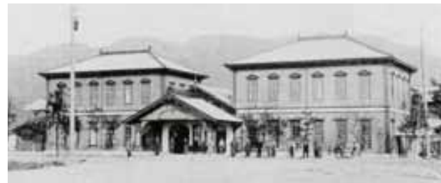
2代目敦賀駅舎

敦賀市の新たな玄関口として、敦賀駅に隣接した「敦賀駅交流施設」が完成し、4月5日(土)から供用開始します。港まち敦賀の「交流の場」「情報発信の拠点」「おもてなしの場」として、多くの市民や敦賀を訪れる方々が快適に利用できる施設となっています。