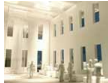
優しい光が落ちてくる待合所