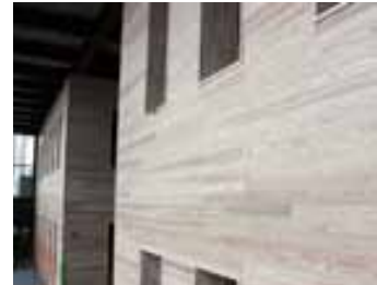
内部は、休憩所や観光案内所、店舗などが入ります