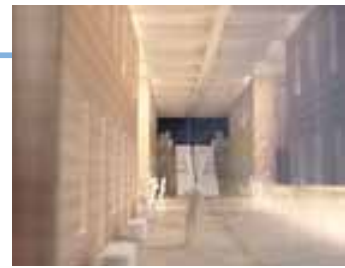
木の壁とガラスに包まれた開放的な回廊空間