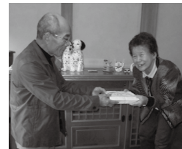
▲昨年の12月、民生委員児童委員から1人暮らしをする高齢者の方々に年越しそばが贈られました

ひとり暮らしの高齢者を訪問し、健康状態や安否を確認するとともに、心の交流を図ります。