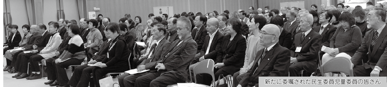
新たに委嘱された民生委員児童委員の皆さん