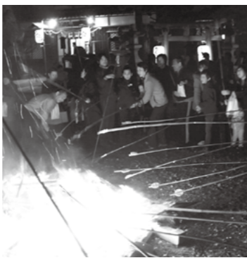
▲せんべい焼きの様子

内容 コスモスの摘み取り、新米おにぎりと汁物の販売、餅つき大会(ふるまい)、地元産新米や農産物などの販売、沖縄太鼓「エイサー」演舞 など その他 コスモスマツリ当日に限り、主要建物が国の重要文化財に指定されている西福寺を無料で拝観することができます。(9時～17時まで。参拝料無料) 問合せ先 農林水産振興課 22・8130