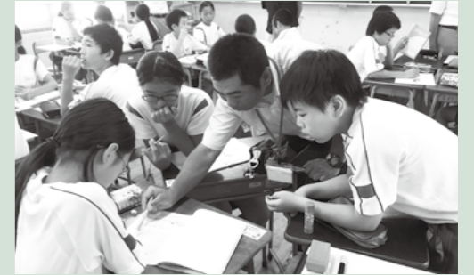
8月に開催した第1回小・小中合同授業の様子

敦賀市教育委員会は、平成28年3月に市が策定した教育の方針「教育に関する大綱」を受け、子どもたちに「勉強して考える力」「内面を豊かにする力」「たくましく生きる力」が身に付くよう「敦賀市『知・徳・体』充実プラン」として、さまざまな取り組みを行っています。