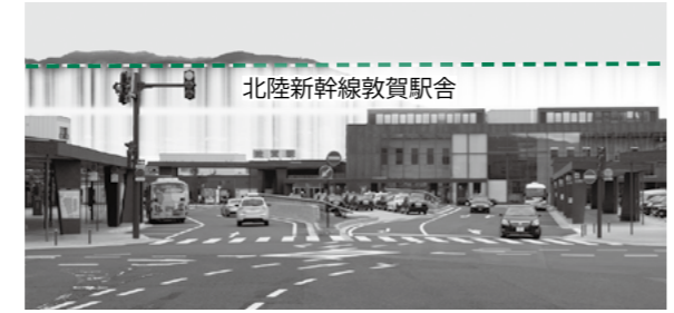
▲敦賀駅正面から見た新幹線駅舎の位置

新しく建設される新幹線駅舎のデザインコンセプトを7月に募集したところ、市内外から48件の応募をいただきました。駅周辺整備構想策定委員会では、募集のあったデザインコンセプトのうち、専門部会で絞り込んだ上記の5案を示しました。