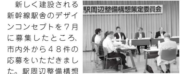
▲駅周辺整備構想策定委員会の様子

今後、候補となった5案について、市民対象のワークショップを開催し、皆さんからもご意見を伺う予定です。その後、それらの意見を踏まえ、専門部会でデザインコンセプト案を作成していきます。なお、最終案のデザインコンセプトについては、ご意見をもとにフレーズの変更などを行うこともあります。